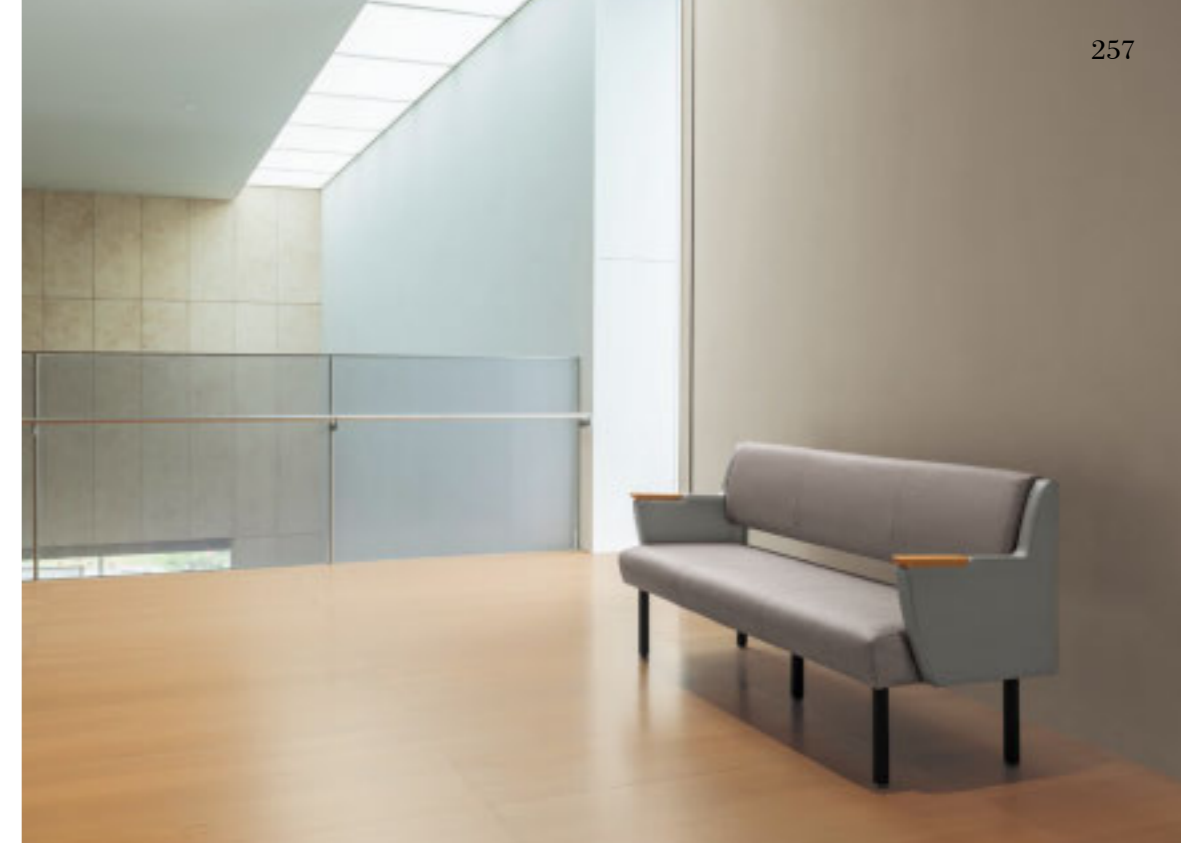
イステルBEW 5N ¥148,200 張材:布地・C-53 (ライトグレー) × レザー・C-17 (No.10) ※ツートン張り:背・座×肘