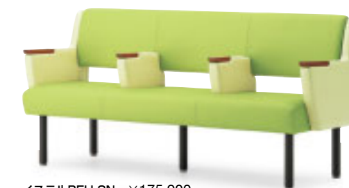
イステルBEH 3N ¥175,900 張材:レザー・B-15 (No.26) × B-15 (No.30) ※ツートン張り:背・座×肘