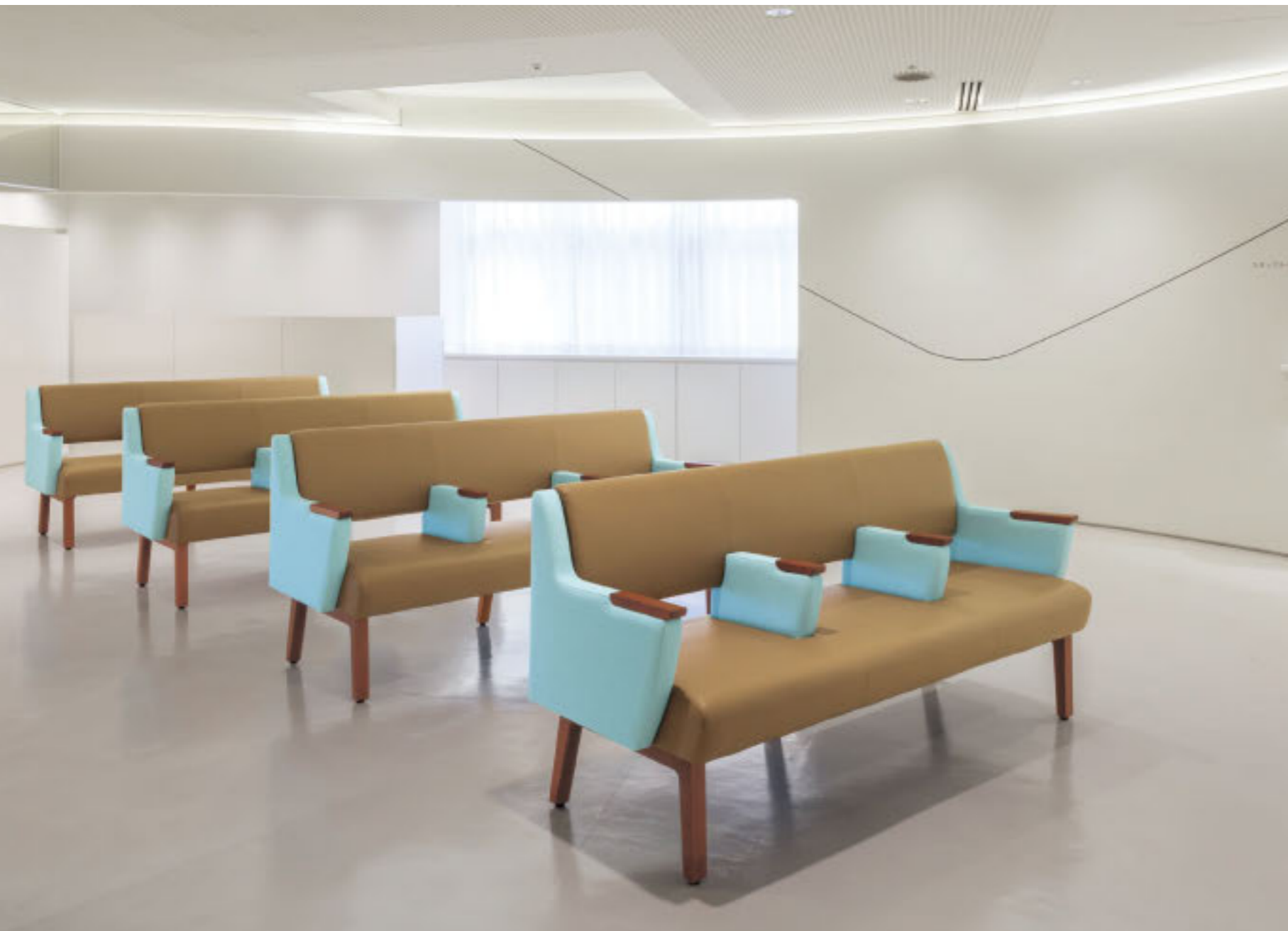
イステルAEH 3N ¥201,000 張材:レザー・B-15 (No.40) × C-38 (No.4) ※ツートン張り:背・座×肘