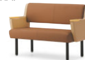
イステルBNW 5N ¥122,900 張材:レザー・A-10 (No.26) × A-10 (No.17) ※ツートン張り:背・座×肘