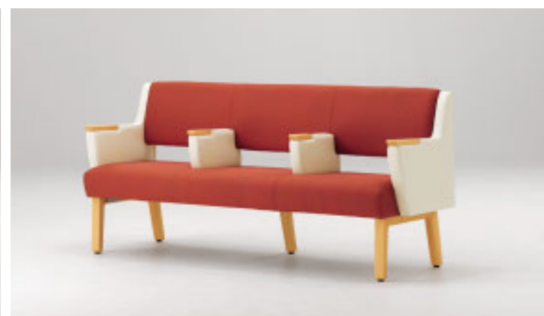
イステルAEH 5N ¥196,700 張材:布地・B-98 (ピンク) × レザー・A-10 (No.3) ※ツートン張り:背・座×肘