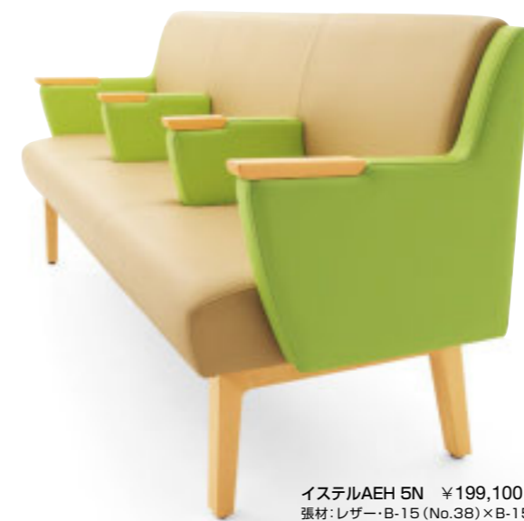
イステルAEH 5N ¥199,100 張材:レザー・B-15 (No.38) × B-15 (No.26) ※ツートン張り:背・座×肘