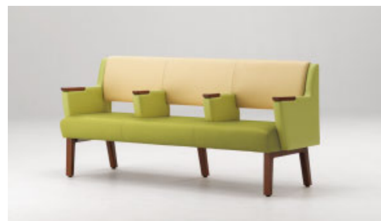
イステルAEH 3N ¥199,100 張材:レザー・B-15 (No.38) × B-15 (No.26) ※ツートン張り:背×肘・座