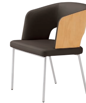
バレトス 5N ¥68,500 張材: レザー・C-22 (No.46)