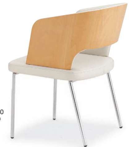
バレトス 5N ¥68,500 張材: レザー・C-22 (No.1)