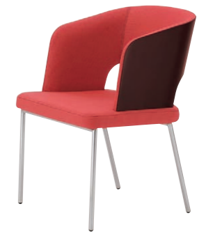
バレトス 1N ¥68,500 張材: 布地・C-53 (コーラル)